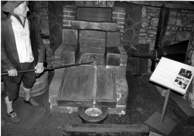
Darstellung der Bleiverhüttung