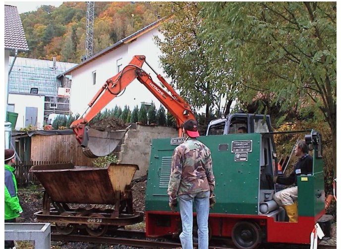
Mit dem Bagger wurde das Lokschuppenfundament ausgehoben und von Lok und Lore das Verfüllmaterial an die Betonmauern des Eingangsbereich gefahren.

Museum: Auch im Museum selbst wurde investiert. Zusätzliche Strahler sind beschafft und der Raum „Weiter-